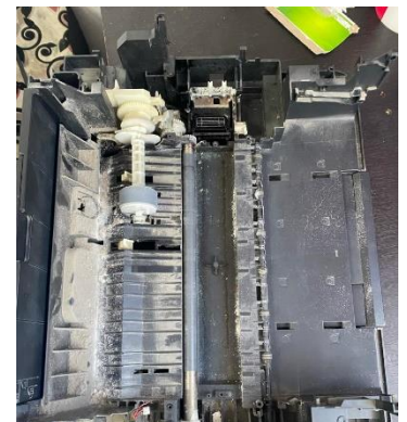
IMPRESORA ANTES DE OVERHAULING