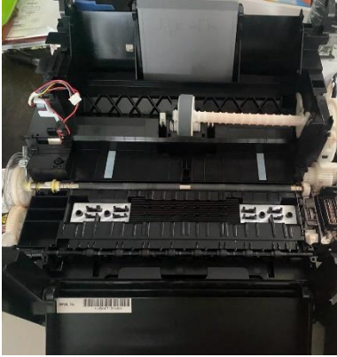
IMPRESORA DESPUES DE OVERHAULING